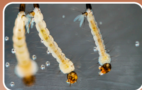
Las larvas viven en el agua.