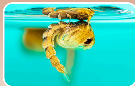
Una pupa viviendo en el agua.