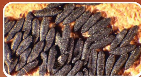
Los huevos tienen aspecto de tierra negra.