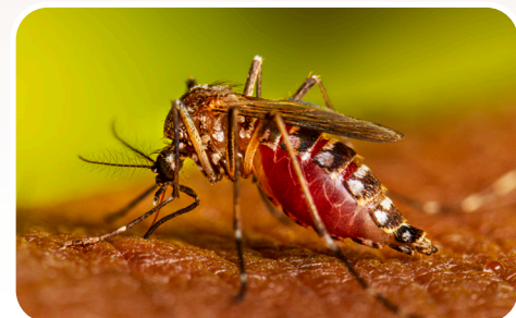
Un mosquito adulto picando a una persona.