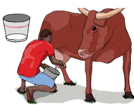
Diminution de la production de lait